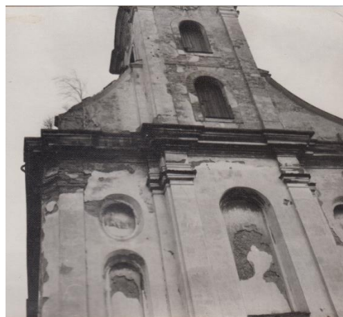
Počátek 70. let 20. století

Na přelomu milénia byl kostel ve velice zanedbaném stavu, zatékalo do něj a vnější omítky opadávaly i s kusy zdiva. Jelikož nebylo v silách chodovské římsko-katolické farnosti zajistit potřebné finance na jeho generální opravu, došlo v závěru roku 2005 k dohodě, na jejímž základě byl kostel sv. Vavřince převeden do majetku města Chodov, které od května do listopadu 2006 realizovalo rozsáhlou opravu: rekonstrukce střechy, oprava vnější omítky, oken a kamenných prvků, včetně vstupního schodiště a výměna či repasování dveří.