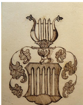
Rodový znak Plankenheimů Panství Chodov drželi v letech 1648 – 1744.

Historicky doložitelné kořeny Chodova spadají do 12. století. S přechodem obce do majetku cisterciáckého kláštera ve Waldsassenu zaznamenává Chodov v průběhu 12. a 13. století velký rozkvět. Klášter se podílel jednak na kolonizaci tohoto území, což zahrnovalo i kulturní vzdělávání, a položil také na dlouhá staletí základy pro stabilizované osídlení a etnickou skladbu obyvatelstva.